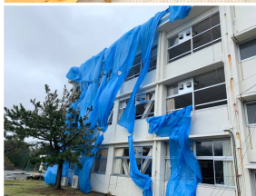
【写真上】小池都知事への申し入れを行う日本共産党都議団（9月17日）【写真下】大島町の都立大島海洋国際高校の現状（9月16日）