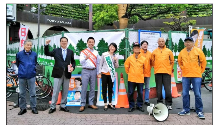
蒲田西口での朝 宣伝(5月10日)

駅頭宣伝・まちかど宣伝を勢いよく楽しくやりましょう。ビラまき、のぼり、プラスタなど。大勢のみなさんの参加をお願いします。