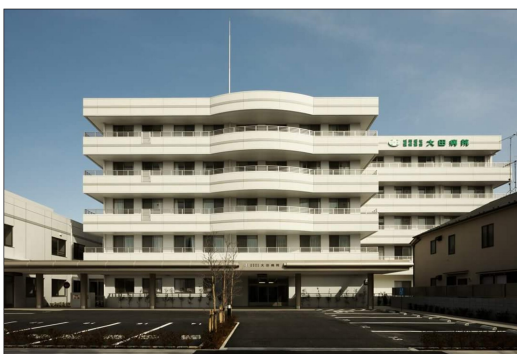
新装なった大田病院 (2010年)

2011年7月には外科病棟の師長に就任。患者さんへの良い医療、看護の提供・働きやすい職場・専門職の知識と技術向上のために、ひたすら