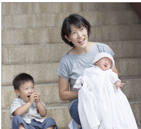
次男の初参りで（左は長男）

（今回も帝王切開です）。師長の業務があるため、今回は次男が4か月の時に職場へ復帰。仕事と育児の両立はさらにハードなものとなり、翌年7月、訪問看護ステーションに異動になりました。初めての訪問看護